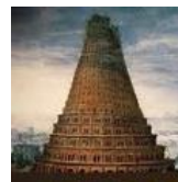
Babel, Gn 11