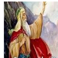
Deuteronômio: o Pentateuco