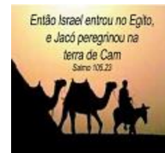
Então Israel entrou no Egito, e Jacó peregrinou na terra de Cam Salmo 105.23