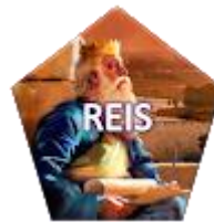
Samuel Saul e Davi