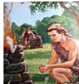
Caim e Abel,4