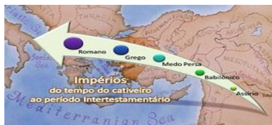
Impérios do tempo dos gentios -x-