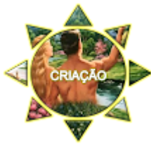
No princípio Gn 1