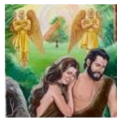
a Queda Gn 3