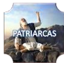
Gn 12 Abraão