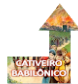
BABILÔNIA DANIEL, EZEQUIEL