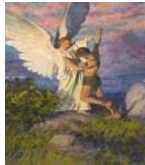
Jacó>Israel, Gn 32