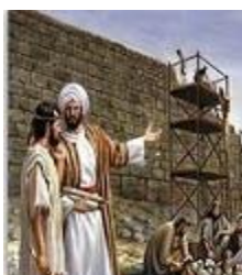
NEEMIAS > MALAQUIAS