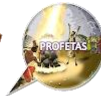
profetas ISAIAS JEREMIAS