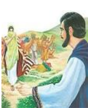
Isaque, Gn 21