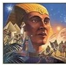
José no Egito, Gn 37