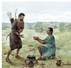
Esaú e Jacó, Gn 25