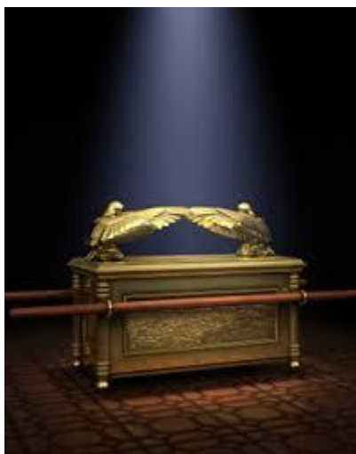
a ARCA, o que oficialmente, restou do Tabernáculo.